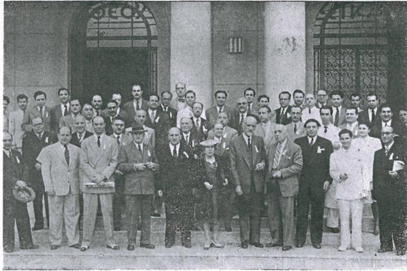
Μεταξύ Ιατρών του Έλληνικού Νοσοκομείου Αλεξανδρείας