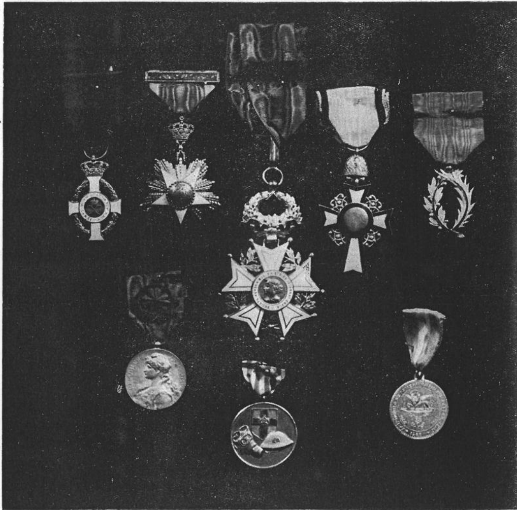
Τὰ παράσημα τῆς Κυρίας Ἁγγ. Παναγιωτάτου