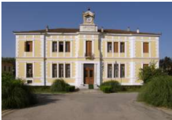
Φωτογραφία της Γεωργικής Σχολής στη Λάρισα

Στη συνέχεια μεριμνά για την ναυπήγηση του Θωρηκτού Αβέρωφ και της ίδρυσης σχολής Ευελπίδων, έργο που θα υλοποιηθεί από την κυβέρνηση Τρικούπη. Για αυτό το έργο ο Αβέρωφ προσέφερε το ασύλληπτο ποσό των 2.500.000 χρυσών φράγκων (ποσό που επαρκούσε για την ναυπήγηση του Θωρηκτού όσο και για την συντήρηση και για την κατασκευή ενός επιπλέον πολεμικού πλοίου). Αυτή η κίνηση θα πρέπει να ερμηνευθεί στο πλαίσιο της ασφάλειας του Ελληνικού Κράτους, και μέσω της καταλληλότητας του πολεμικού δυναμικού σε μια αναγνώριση της Ελλάδος ως πολεμική δύναμη. Ωστόσο, προτού προχωρήσουμε παρακάτω να επισημάνουμε τον όρο που βάζει ο Αβέρωφ, βάσει του οποίου ονοματοδοτεί το θωρηκτό. Εδώ συναντάμε την προσπάθεια του ευεργέτη να αναγνωριστεί μέσα από αυτή του την πράξη και να παραμείνει το κύρος του γνωστό στις επόμενες γενιές.