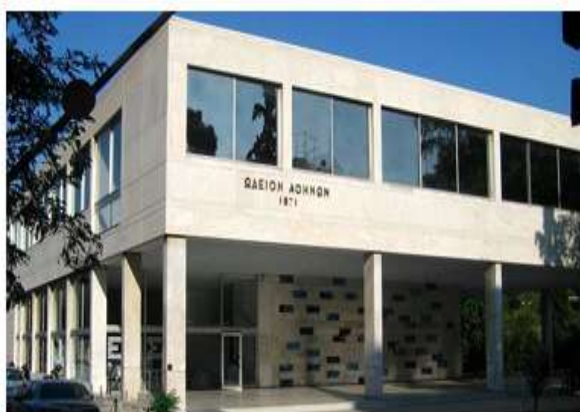
Φωτογραφία του Ωδείου Αθηνών

Ο Γεώργιος Αβέρωφ επιπροσθέτως δίνει χρήματα για την αποπεράτωση του Πολυτεχνείου Αθηνών , την παροχή βραβείων και υποτροφιών που θα φέρουν το όνομα του και την προσφορά των ελαιογραφιών του στο Πολυτεχνείο. Ένα βήμα προς την ανάπτυξη του πνεύματος , προς την εκπαίδευση και την πρόοδο του ανθρώπων. Και τέλος προνοεί μέσω της διαθήκης του για μία ιδιαίτερη ευεργεσία για παροχή βραβείων και υποτροφιών για το Ωδείο Αθηνών. Χαρακτηριστικά, ο Αβέρωφ αναφέρει στην διαθήκη του ότι η μουσική εξευγενίζει το πνεύμα και διαπλάθει το ήθος των ανθρώπων και πως η από σκηνης διδασκαλία (το θέατρο) μόρφωνε τους Αρχαίους Έλληνες και το ίδιο εξακολουθεί να κάνει ακόμα και σήμερα. (Τι αντίληψη για ένα άνθρωπο που ξεκίνησε ως ένα φτωχό βοσκόπουλο σε ένα ορεινό χωριό της Ηπείρου!). Εδώ καλούμαστε τώρα να ερμηνεύσουμε αυτήν του την ευεργεσία ως πράξη επιρροής από την Δύση και τις Ευρωπαϊκές Ιδέες και ιδού πως η διασπορά και η επαφή των ανθρώπων με άλλους πολιτισμούς τους επηρεάζει και έχει ως αποτέλεσμα την δημιουργία ταυτοτήτων.