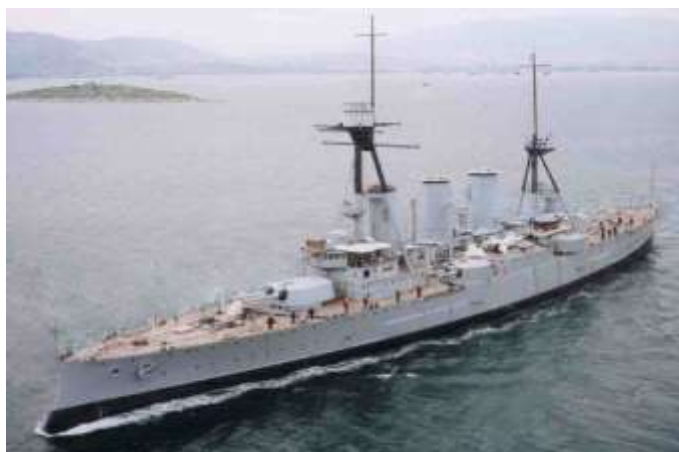
Φωτογραφία του Θωρηκτού Αβέρωφ

Ο Γεώργιος Αβέρωφ επιπροσθέτως δίνει χρήματα για την αποπεράτωση του Πολυτεχνείου Αθηνών , την παροχή βραβείων και υποτροφιών που θα φέρουν το όνομα του και την προσφορά των ελαιογραφιών του στο Πολυτεχνείο. Ένα βήμα προς την ανάπτυξη του πνεύματος , προς την εκπαίδευση και την πρόοδο του ανθρώπων. Και τέλος προνοεί μέσω της διαθήκης του για μία ιδιαίτερη ευεργεσία για παροχή βραβείων και υποτροφιών για το Ωδείο Αθηνών. Χαρακτηριστικά, ο Αβέρωφ αναφέρει στην διαθήκη του ότι η μουσική εξευγενίζει το πνεύμα και διαπλάθει το ήθος των ανθρώπων και πως η από σκηνης διδασκαλία (το θέατρο) μόρφωνε τους Αρχαίους Έλληνες και το ίδιο εξακολουθεί να κάνει ακόμα και σήμερα. (Τι αντίληψη για ένα άνθρωπο που ξεκίνησε ως ένα φτωχό βοσκόπουλο σε ένα ορεινό χωριό της Ηπείρου!). Εδώ καλούμαστε τώρα να ερμηνεύσουμε αυτήν του την ευεργεσία ως πράξη επιρροής από την Δύση και τις Ευρωπαϊκές Ιδέες και ιδού πως η διασπορά και η επαφή των ανθρώπων με άλλους πολιτισμούς τους επηρεάζει και έχει ως αποτέλεσμα την δημιουργία ταυτοτήτων.